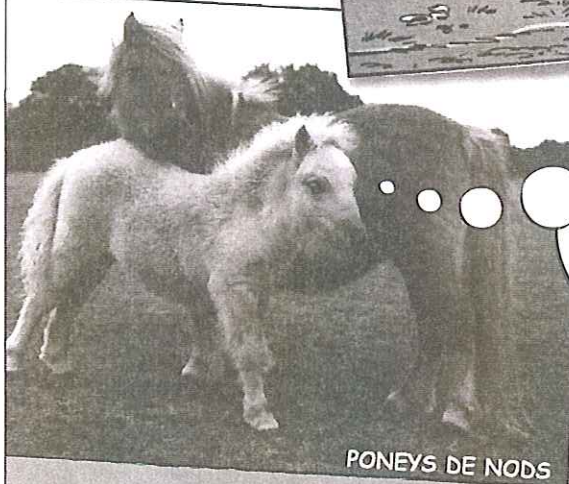
PONEYS DE NODS